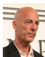
Herzog & de Meuron ジャック・ヘルツォーク スイス(2007)