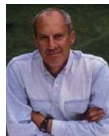
Norman Foster ノーマン・フォスター イギリス(2002)