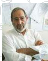
Alvaro Siza アルヴァロ・シザ ポルトガル(1998)