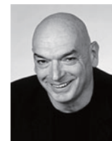
Jean Nouvel ジャン・ヌーヴェル フランス(2001)