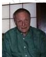
Richard Rogers リチャード・ロジャース イギリス(2000)