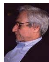
Frank O. Gehry フランク・O.ゲリー アメリカ(1992)