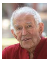
Ricardo Legorreta リカルド・レゴレッタ メキシコ(2011)