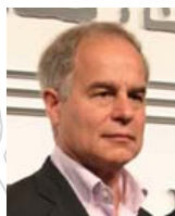
Herzog & de Meuron ピエール・ド・ムーロン スイス(2007)