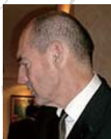
Rem Koolhaas レム・クoolハース オランダ(2003)