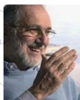
Renzo Piano レンゾ・ピアノ イタリア(1995)