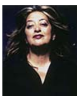
Zaha Hadid ザハ・ハディド イギリス(2009)